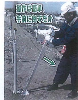
杭抜き50 打ち込んだ単管を引き抜くのに 便利な杭抜き工具