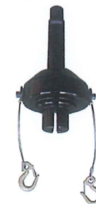
H鋼150角,100角用打込工具(オプション) 質量 22.0kg