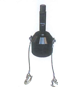
打撃面フラットの標準工具 質量 23.5kg