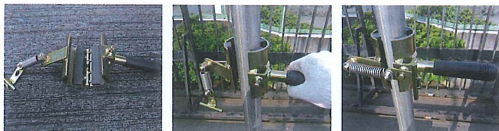
取付はワンタッチ

●単管パイプ用防音具 単管パイプに取り付けて使用することにより単管打ち込み時の騒音の高音域を8dB低減します。