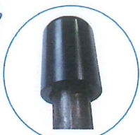
KH-240V用 単管キャップ (オプション品)