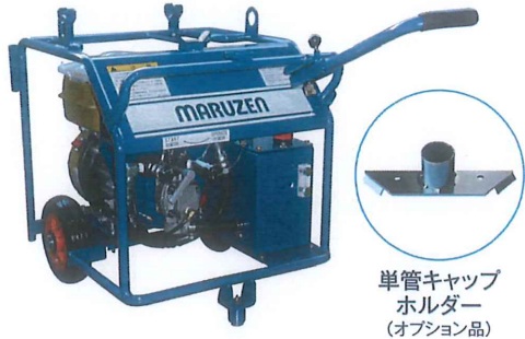
単管キャップホルダー (オプション品)