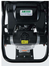
● クランクケース一体型 フレクリーナー