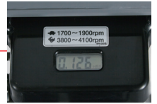
● タコ・アワーメーター