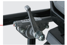
● 三位置オリジナル調速レバー