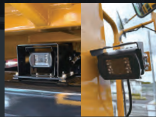
サイド&バックカメラ

死角になりやすい場所の安全を運転席から確認出来るようにサイドカメラとバックカメラを標準装備