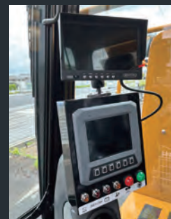
モニタディスプレイ類