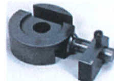
直角曲げカラー (SD345以下のみ対応)